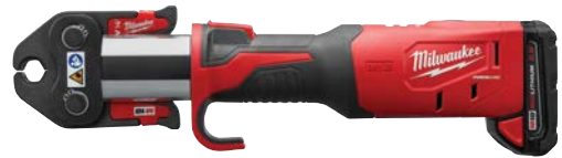
M18 FORCE LOGIC 壓接器