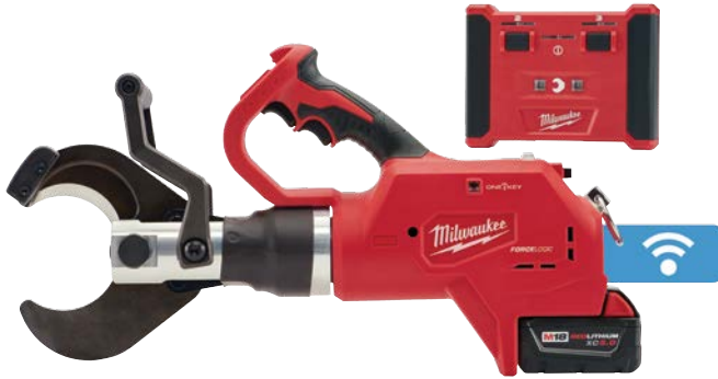
M18 FORCE LOGIC 3" 地下電纜切割器 連無線遙控器