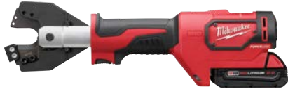
M18 FORCE LOGIC 電纜剪鉗 連477 ACSR 鉗口