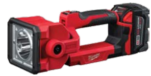
M18 LED 射燈