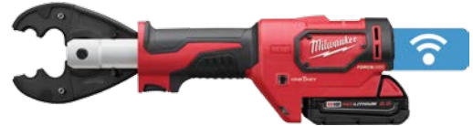
M18 FORCE LOGIC 6T 高強壓接器 連D3套管及固定BG型鉗口