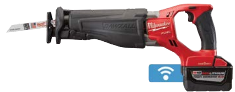
M18 FUEL SAWZALL 往復鋸 (配備ONE-KEY功能)