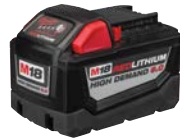
M18 REDLITHIUM HIGH DEMAND 9.0 電池組

MILWAUKEE M18充電式系統代表專業級功率、性能超卓及結合人體工程學設計而產生最佳的協同效應。該系列的旗艦產品M18 FUEL提供的解決方案是同類產品中性能最高的工具。隨著革命性的M18 REDLITHIUM HIGH DEMAND 9.0電池組面世，MILWAUKEE品牌打破充電工具的限制，即使在最嚴苛的應用情況下仍能提供持久電力。