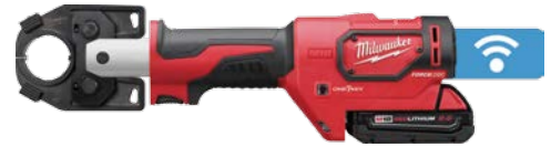
M18 FORCE LOGIC 600 MCM Cu/350 MCM Al 高強壓接器