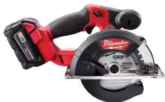
M18 FUEL 金屬用圓鋸