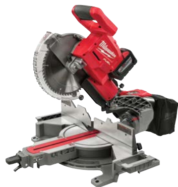
M18 FUEL 10°雙斜面滑動混合橫切鋸