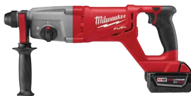
M18 FUEL 1" SDS Plus D型手柄旋轉磁鑽