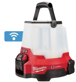
M18 RADIUS LED 手提式 工地燈 (配備ONE-KEY功能)