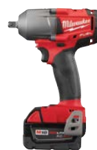
M18 FUEL 1/2"中等扭力 衝擊扳手連鎖釘制動器