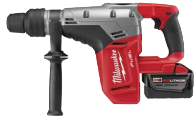
M18 FUEL 1-9/16" SDS Max 鎚鑽