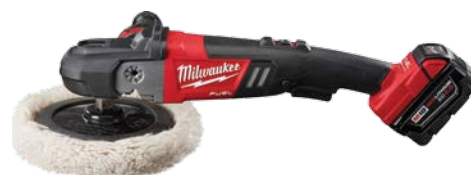
M18 FUEL 7"調速打磨機