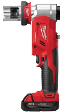
M18 FORCE LOGIC 6 噸穿孔衝壓器