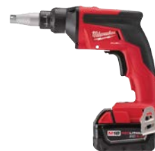
M18 FUEL 石膏牆螺絲起子機