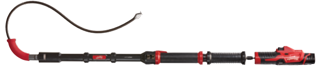
M12 TRAPSAKE 6" 馬桶疏通器