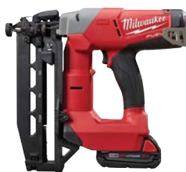
M18 FUEL 16度直釘槍