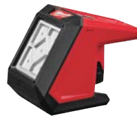
M12 ROVER LED 泛光燈

二零一六年MILWAUKEE品牌令人眼前一亮的嶄新產品乃是推出高輸出照明裝置，從工作燈、工地燈、泛光燈到塔燈，這些充電式LED照明解決方案適用於專業工匠在工地陰暗惡劣的環境下工作。