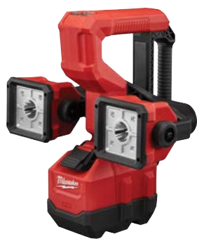
M18 LED 工具箱夾燈