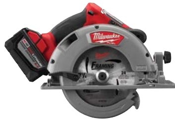
M18 FUEL 7-1/4" 圓鋸