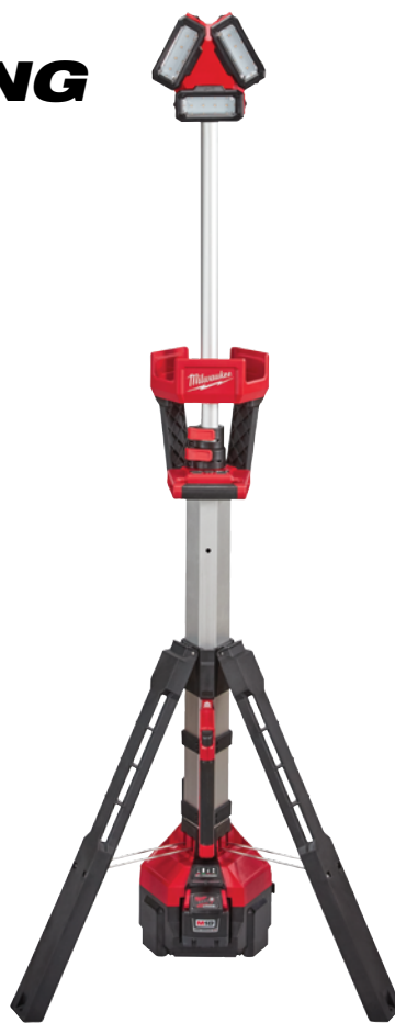
M18 ROCKET LED 塔型工地燈/充電器