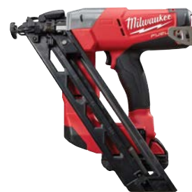
M18 FUEL 15度斜排釘槍